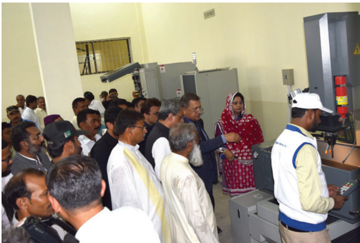
Brifing on EDM (Machining Hall)