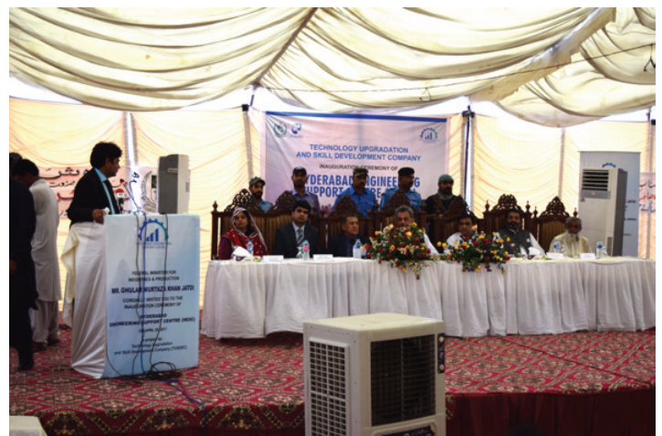
Proceedings of Inaugural Ceremony