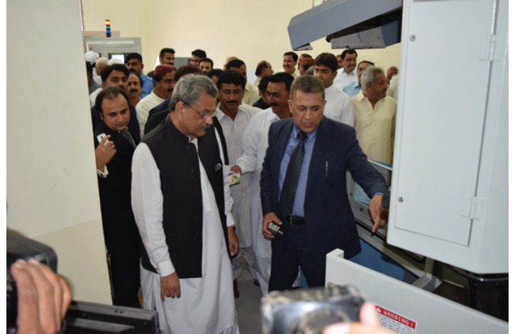
Brifing on Wire Cut Machine (Machining Hall)