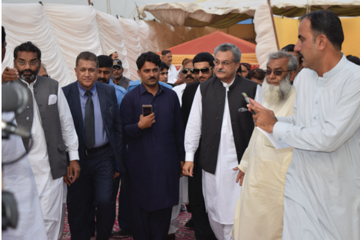
Chief Guest's Arrival