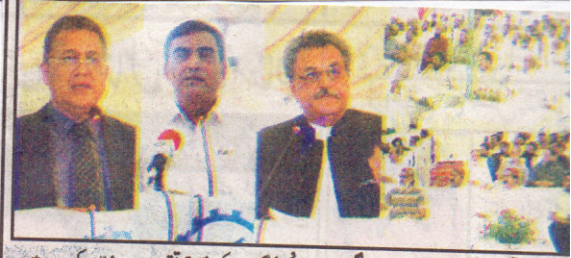
وزیر غلام مرتضیٰ جوتی، ضیاء الدین اور محمد عالم کیر چوہدری انجینئرنگ سینٹر کی افتتاحی تقریب سے خطاب کر رہے ہیں۔