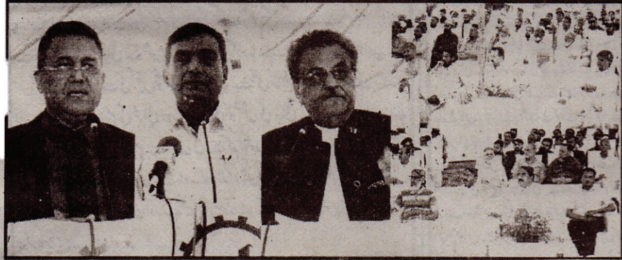
حیدرآباد: وفاقی وزیر صنعت و پیداوار غلام رفیع خاں جتوئی ایوان صنعت و تجارت کے نائب صدر ضیاء الدین و دیگر منعقدہ تقریب سے خطاب کر رہے ہیں

جلد نمبر 30: اتوار 30 اپریل 2017 عیسوی بمطابق 03 شعبان 1438 ہجری شماری شمار نمبر 119