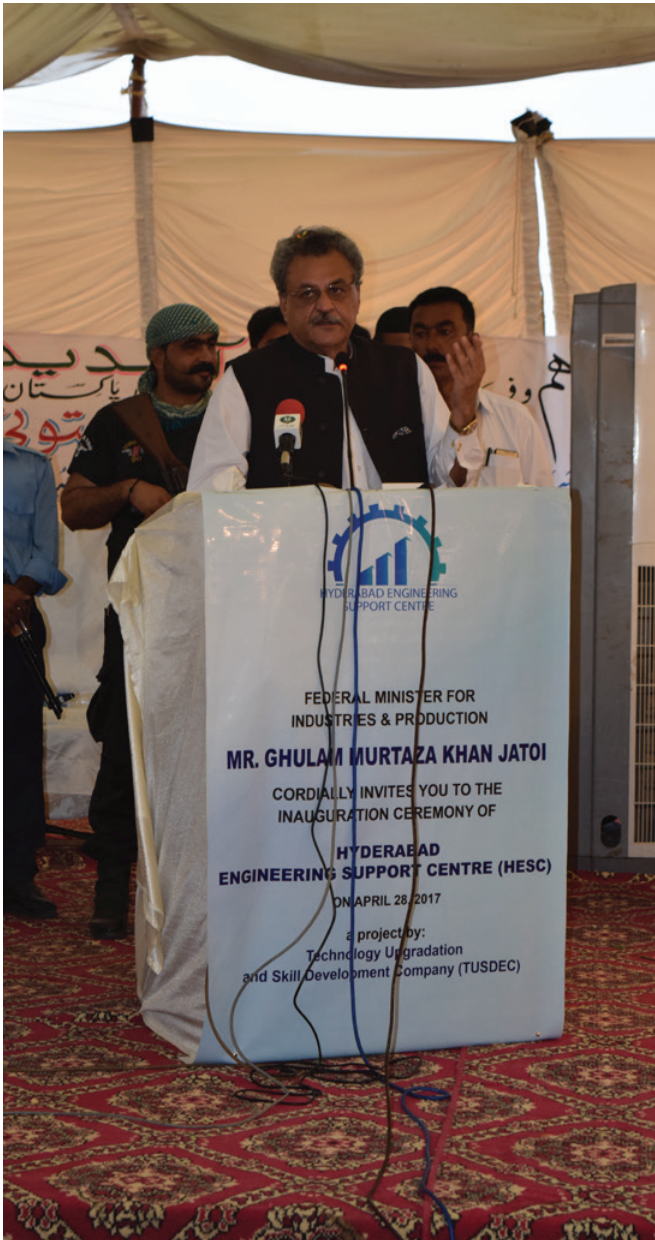
Address by the Chief Guest