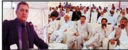
ٹسڈک کے چیف ایگزیکٹو عہدے چوہدری اسحاق علی خان نے ملک میں تقریب سے خطاب کر رہے ہیں