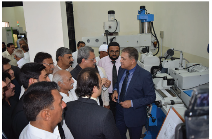
Cylindrical Grinding Machine