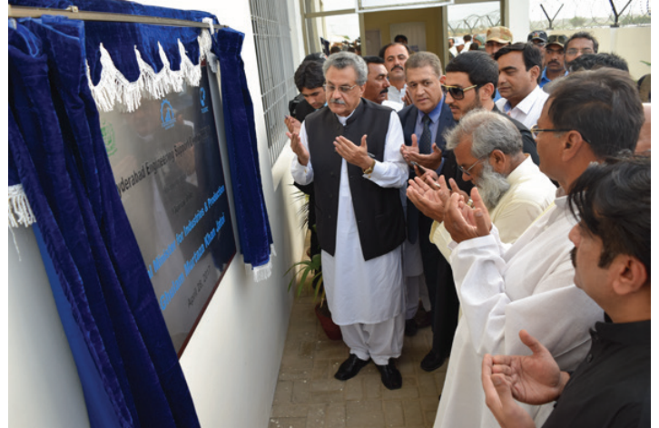
Inauguration of HESC