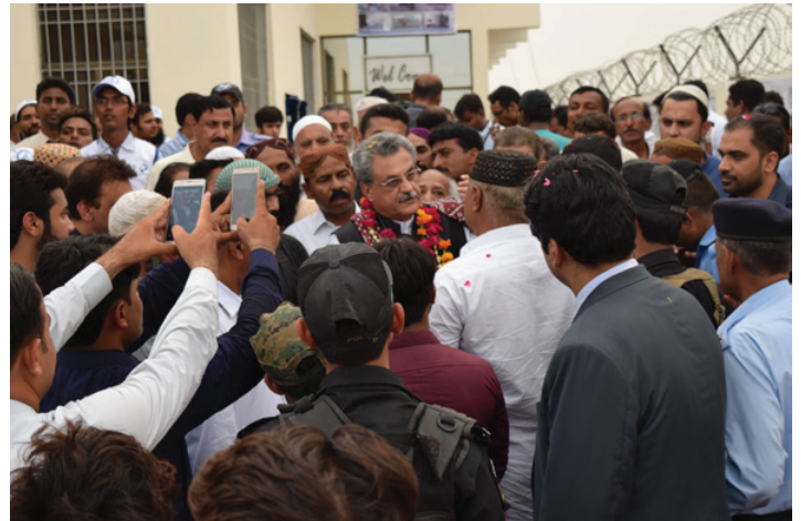
Interaction with Media