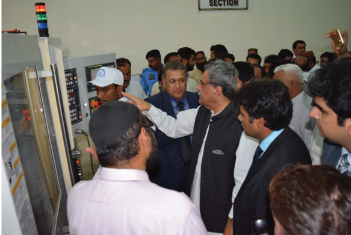
Brifing on CNC Turning Cutting (Machining Hall)