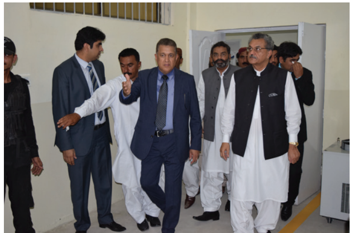
Visit to Machining Hall